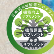
青木医師により選ばれた 美やせサプリメント